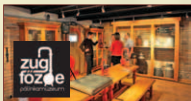
Zugfőzde Pálinkamúzeum Visegrád